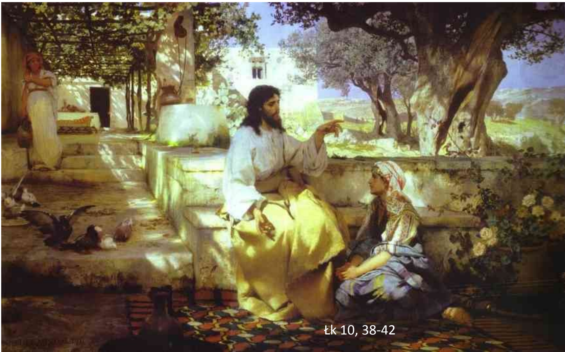
Obraz Henryka Siemiradzkiego (1886)